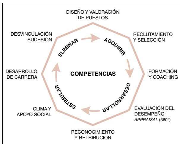
Figura 2. Procesos en la gestión por competencias

En la figura 2 se muestra esquemáticamente el proceso de gestión por competencias que parte del análisis y valoración de puestos a partir de un inventariado de competencias adecuado a cada realidad específica, facilita luego la selección de personal y la formación necesaria para la adquisición de las competencias requeridas, la evaluación de su desempeño en los puestos de trabajo con los correspondientes mecanismos de reconocimiento y retribución, contribuyendo a un buen clima laboral, y finalmente, el establecimiento de la carrera profesional, previendo incluso hasta el momento de producirse, la desvinculación laboral de la persona.