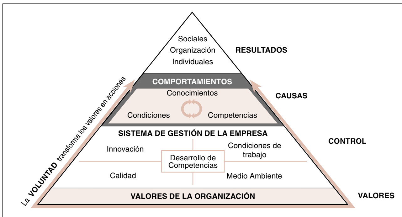
Figura 1. Modelo integral de gestión empresarial

basado en el diálogo, que facilita la toma de conciencia de la necesidad de su evaluación y de su control, con la implicación y el compromiso de la dirección y de los trabajadores o de sus representantes, no solo ayudará a conciliar posturas, si no que se estarán también creando las condiciones que harán posible la construcción de nuevas realidades y de un sistema general de gestión empresarial en el que todos se sentirán copartícipes, algo esencial para poder conducir con éxito todo proceso de cambio.